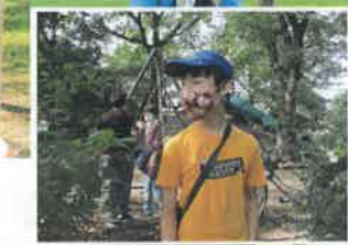
ボードはみんなの自信作